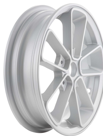
SIP 6507 Silber / SIP 6507 Silver