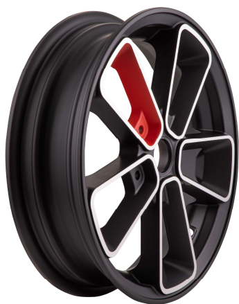
SIP 6507 Schwarz-Rot / SIP 6507 Black-Red

Rad SIP 6507 in verschiedenen Farbvarianten (weitere Farbvarianten zulässig): / Wheel SIP 6507 in various colours (further colours permissible):