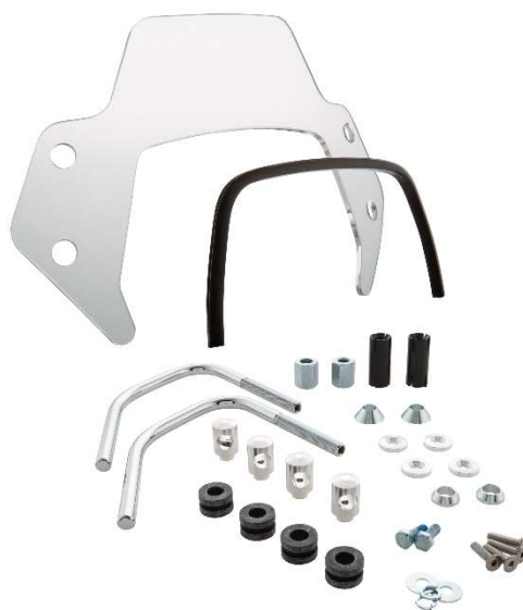
Windschild SIP MV656044 – 1C