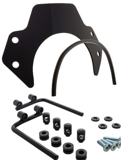
Windschild SIP MV656044 – 2B

Fahrzeugteilart / Vehicle part type : Windschild für Krafträder / Windshield for motorcycles Typ / Type : SIP MV656044 Antragsteller / Applicant : SIP Scootershop GmbH