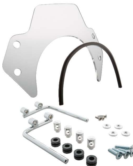
Windschild SIP MV656044 – 2C