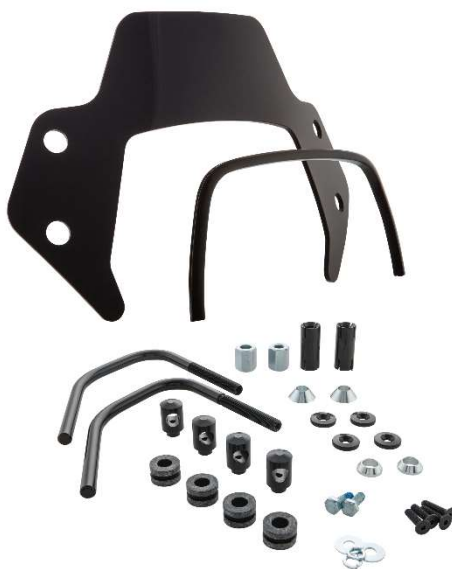
Windschild SIP MV656044 – 1B