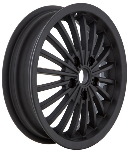
SIP 6506 Schwarz / SIP 6506 Black

Rad SIP 6506 in verschiedenen Farbvarianten (weitere Farbvarianten zulässig): / Wheel SIP 6506 in various colours (further colours permissible):