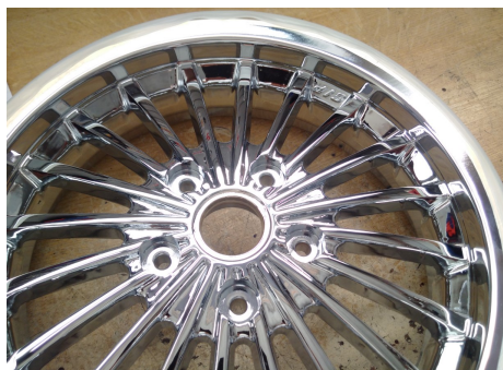
SIP 6506 Chrom / SIP 6506 Chrome