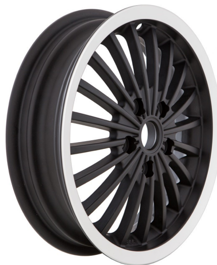
SIP 6506 Schwarz / SIP 6506 Black (mit poliertem Rand) / (with polished flange)