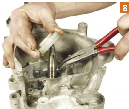
8 Zuletzt kann nun noch das Antriebs-schneckenrad abgenommen werden. Achtung: Mitnehmerstift nicht vergessen!

SIP-TIPP! Echte Tuningfreaks können mit Hilfe der Stroboskoplampe und der Gradscheibe ihre Zündung perfektionieren. Dafür muss man die Befestigungslöcher der Zündgrundplatte zu Langlöchern umarbeiten. Nähere Info unter www.sip-scootershop.de bei den Artikeldetails.