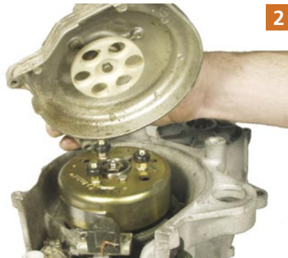
2 Bei luftgekühlten Motoren ebenfalls einfach Deckel abnehmen. Man hat nun freie Sicht auf das Polrad.