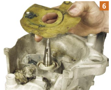
6 Jetzt noch die Dichtung entfernen. Man hat freien Blick auf die Ölpumpe.