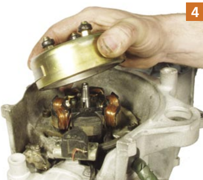
4 Nicht klopfen oder mit Gewalt arbeiten, wenn das Polrad unrund läuft ist es nicht mehr zu gebrauchen!