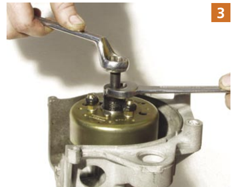
3 Nach Öffnen und Entnehmen der Zentralmutter mit Hilfe des Polradabziehers Polrad abziehen.