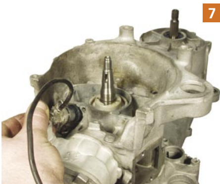
7 Die beiden Inbusschrauben an der Ölpumpe lösen um diese auszubauen.