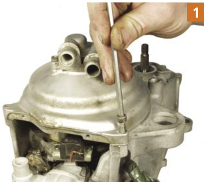
1 Nach dem Öffnen der Deckelschrauben lässt sich die Wasserpumpe abnehmen.